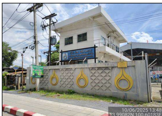
สถานีควบคุมความดันและวัดปริมาตรก๊าซรังสิต