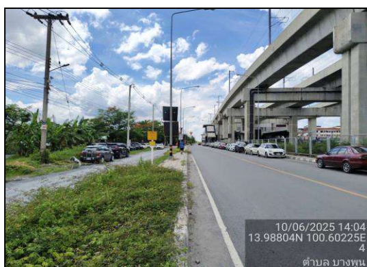
ป้ายเตือนแนวท่อส่งก๊าซในเขต ทางหลวงหมายเลข 3100