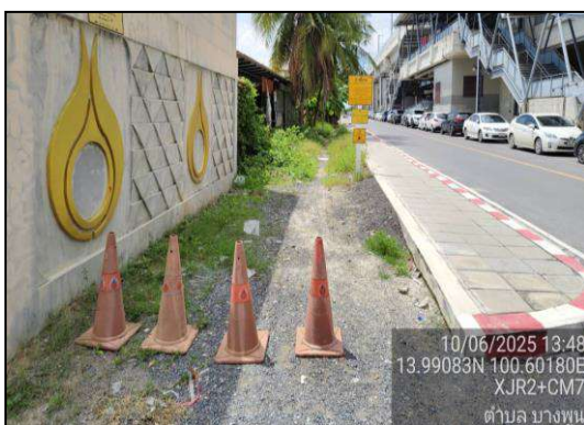
เบอร์โทรฉุกเฉิน (1540) ที่แสดงบนป้ายเตือนฯ

ภาพที่ 3.2-3 ระบบความปลอดภัยของโครงการท่อส่งก๊าซธรรมชาติศูนย์ราชการแจ้งวัฒนะ และศูนย์พลังงานแห่งชาติ (ปทุมธานี-พญาไท) (การขอเปลี่ยนแปลงรายละเอียดโครงการในรายงานการวิเคราะห์ผลกระทบสิ่งแวดล้อม โครงการท่อส่งก๊าซธรรมชาติศูนย์ราชการแจ้งวัฒนะและศูนย์พลังงานแห่งชาติ (ปทุมธานี-พญาไท) (ครั้งที่ 1))