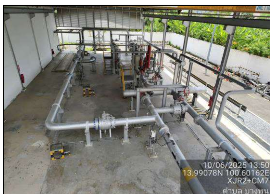
สถานีควบคุมความดันและวัดปริมาตรก๊าซฯ ศูนย์ราชการแจ้งวัฒนะ