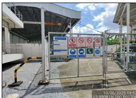
ป้ายเตือนความปลอดภัย