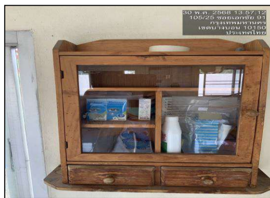
ภาพที่ 3.2-7 อุปกรณ์ปฐมพยาบาลเบื้องต้น ณ ศูนย์ปฏิบัติการระบบท่อเขต 6