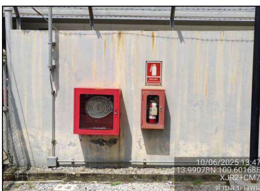
ถังดับเพลิง