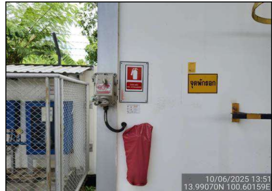
อุปกรณ์ป้องกันการระเบิด (Explosion Proof)