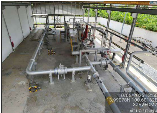
บริเวณภายในสถานีควบคุมความดันและวัด ปริมาตรก๊าซฯ